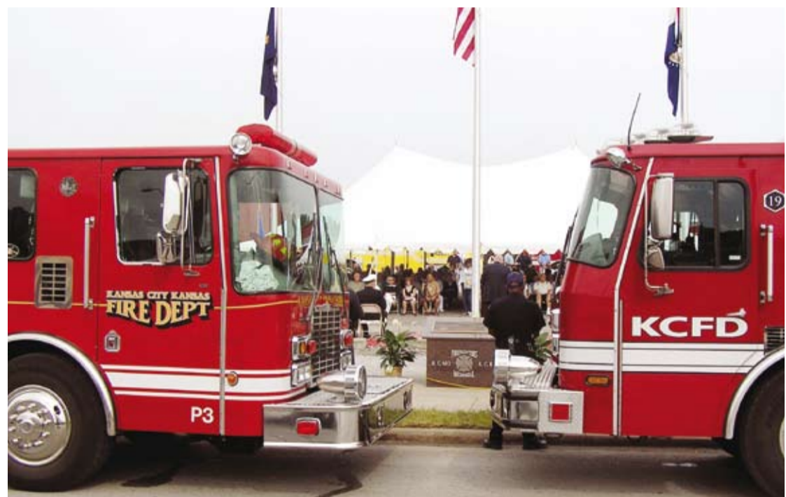
Tuesday marked the 50th anniversary of a fire that occurred at the intersection of Southwest Boulevard and 31st Street. Firefighters from both sides of the state line gathered at a memorial ceremony to remember the fallen and the survivors who fought in what some described as the largest inferno in 1959.

El Martes marcó el 50 aniversario del incendio ocurrido en la intersección de Southwest Boulevard y la Calle 31. Bomberos de los dos lados de la línea estatal se reunieron para rendir una ceremonia de homenaje para recordar los caídos y los sobrevivientes que pelearon en lo que muchos describen como el infierno más largo de 1959.